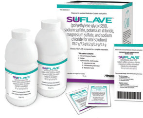
الزجاجات والأكياس لا تظهر بالحجم الفعلي.